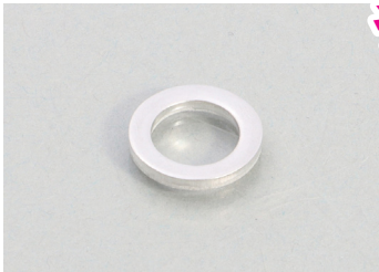
アルミドレンワッシャとして使用できます。