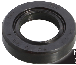
NSR50系キックスピンドル用オイルシール (16×28×7) がラインナップ。